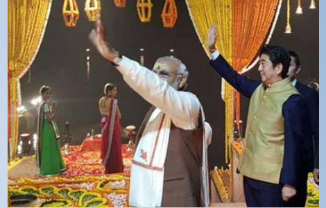
गंगाघाट पर लोगो का अभिवादन स्वकारते