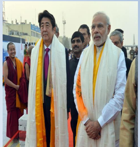
सारनाथ क्षेत्र में भ्रमण करते हुए