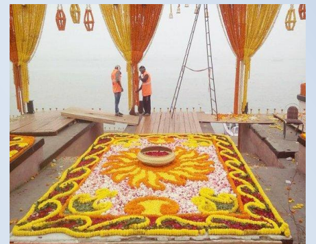
प्रस्थान मार्ग व घाट पर स्वागत फूलों से सजावट

दिनांक 11 दिसम्बर 2015 को मा० प्रधानमंत्री श्री नरेन्द्र मोदी, के जापानी समकक्ष मा० प्रधानमंत्री श्री शिन्जो अबे का अगमन हुआ। वाराणसी के नागरिकों द्वारा श्री अबे का भव्य स्वागत किया गया।