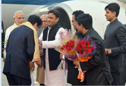
बाबतुर एअरपोर्ट पर मा० मुख्यमंत्री द्वारा स्वागत