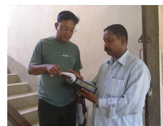
मशीन द्वारा भवन स्वामी का गृहकर जमा करते हुए