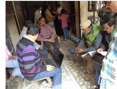
गृहकर वसूली हेतु कैम्प