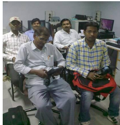
स्पॉट बिलिंग मशीन का प्रशिक्षण